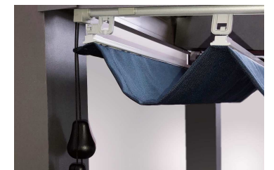
CORD Bedienung mit Zugschnur