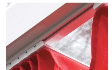
HAND Statik außenliegend Montage unter den Sparren