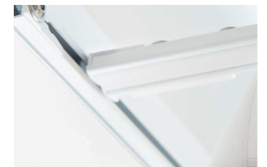
HAND Statik innenliegend Montage zwischen den Sparren